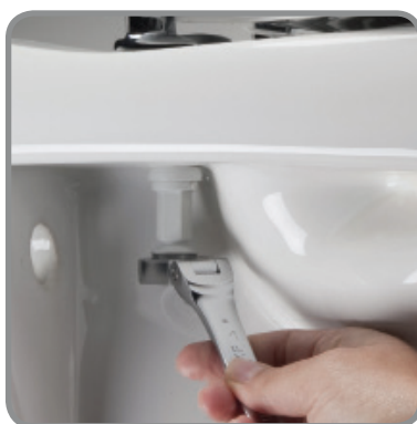
vastdraaien met ring/ steeksleutel