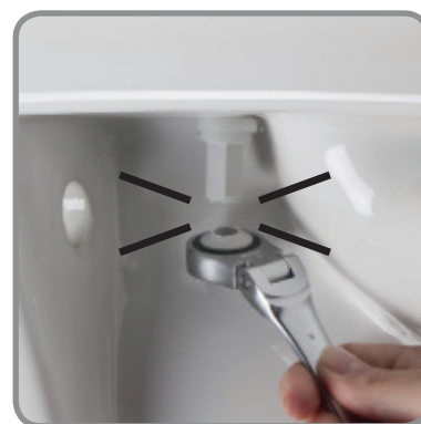
Breekt af bij de juiste fixatie