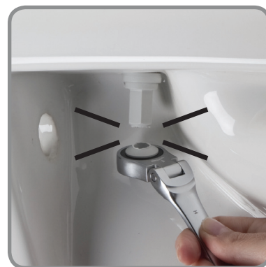
Breekt af bij de juiste fixatie