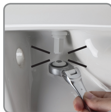
Breekt af bij de juiste fixatie