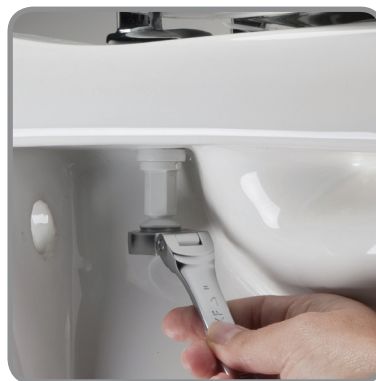
vastdraaien met ring/ steeksleutel