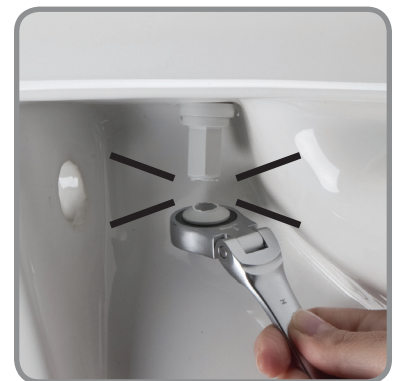
Breekt af bij de juiste fixatie